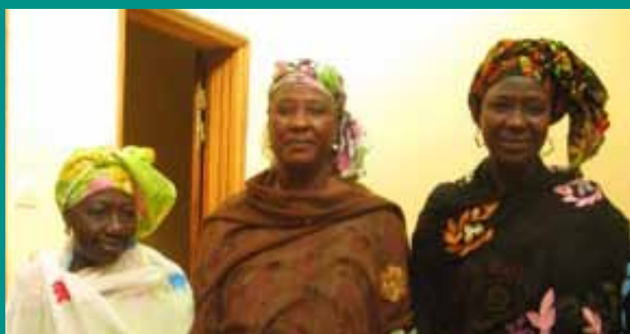
Les matrones de la maternité de Gorom 1

Grâce à votre soutien, en mars 2013 nous avons pu livrer un conteneur d'équipements médicaux d'une valeur de 55 000$ à la maternité de Gorom I. Le centre est désormais ouvert et peut recevoir des patients.