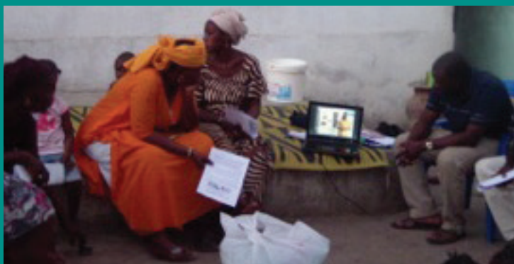
Les femmes regardent une vidéo sur la formation

... de plus, en Janvier 2014 nous avons lancé notre projet Serviettes SantéVie®, dont l'objectif est la fabrication puis la distribution de serviettes hygiéniques réutilisables en coton. Ce projet représente une innovation pour le développement durable et l'entreprenariat des femmes. Il propose ainsi une solution pour un problème social et de santé publique – le maintien des filles à l'école.