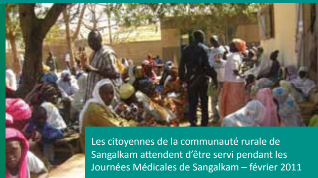
Les citoyennes de la communauté rurale de Sangalkam attendent d'être servi pendant les Journées Médicales de Sangalkam – février 2011

Jusqu'ici, nous avons amassé 4,957$ de dons et de levées de fonds notamment notre campagne Brique par Brique .