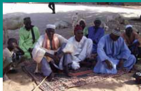
Citoyennes du village Gorom 1

Si vous souhaitez faire du bénévolat ou être averti des progrès et des événements, s'il vous plaît envoyez un courriel à senegalsantemobile@videotron.ca y compris votre nom, adresse, et téléphone.